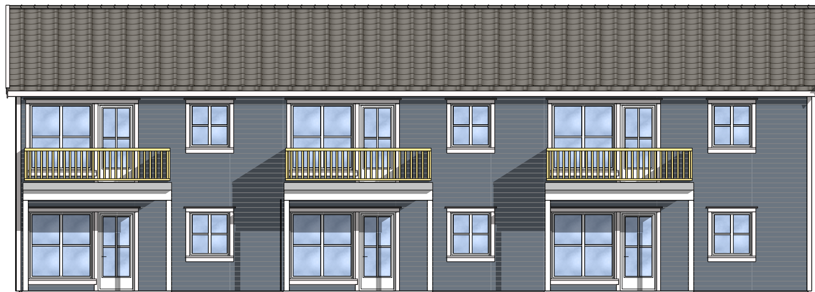
FASADE MOT: SYD