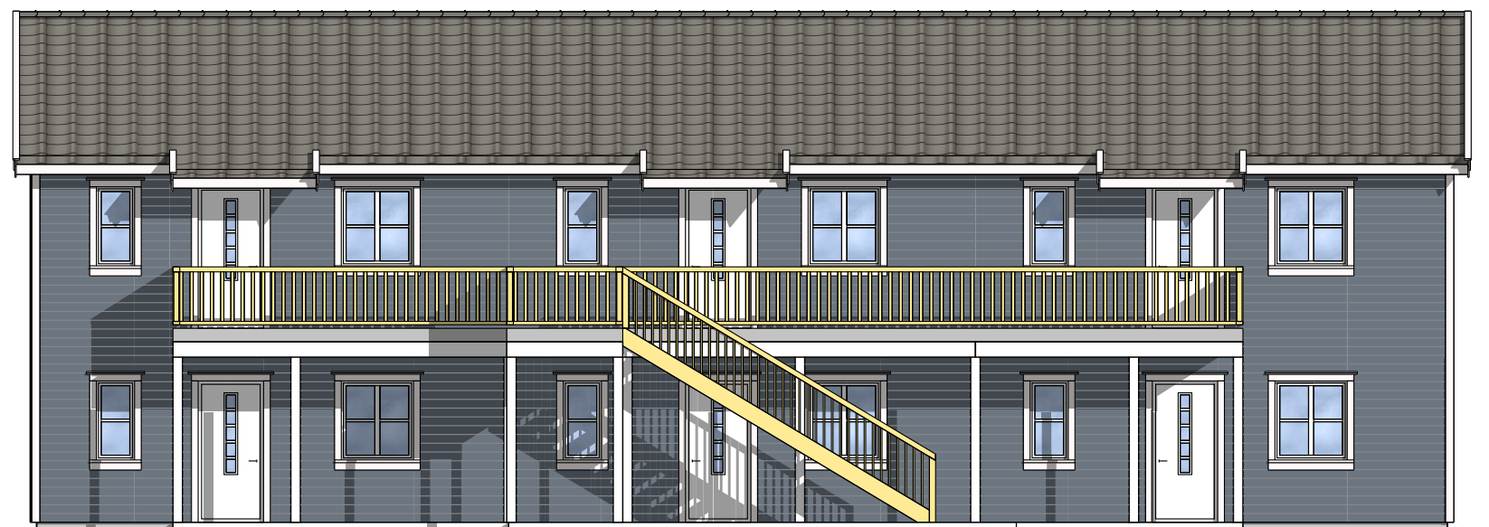
FASADE MOT: NORD