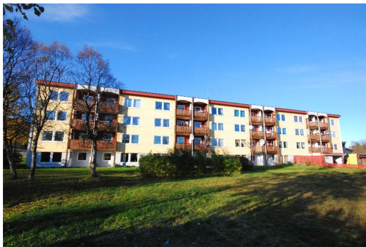
Kong Øysteinsvei 11 (Bjørkmo)

Takrenner blir kontrollert mer eller mindre hvert år.