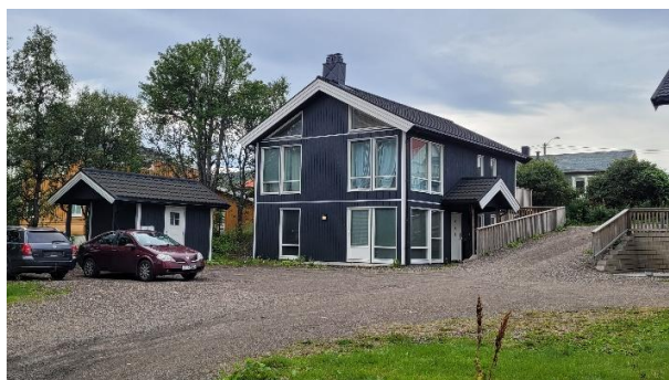
Vesterålsgata 27 sør