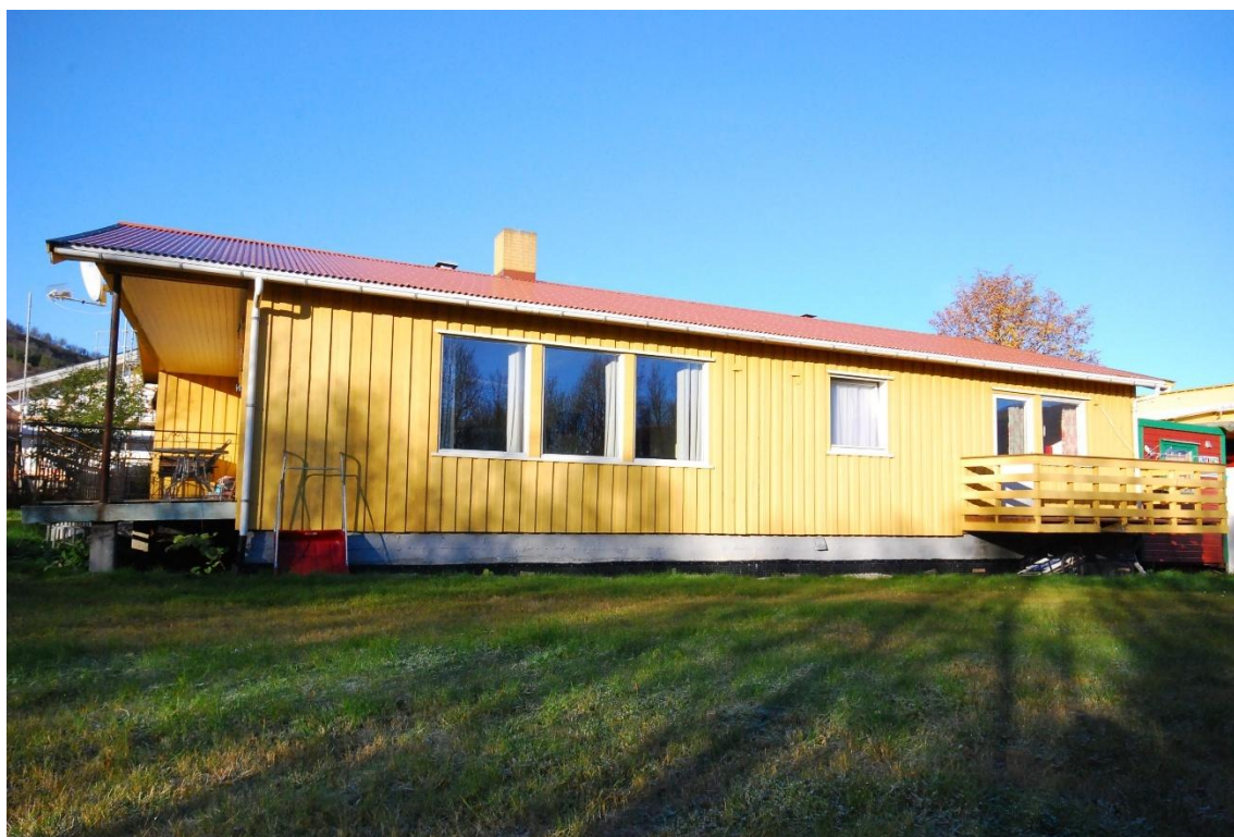
Kong Øysteins vei 21