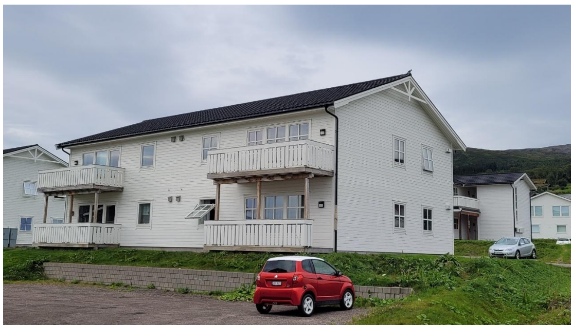
Bakkelia 119, 121 og 123