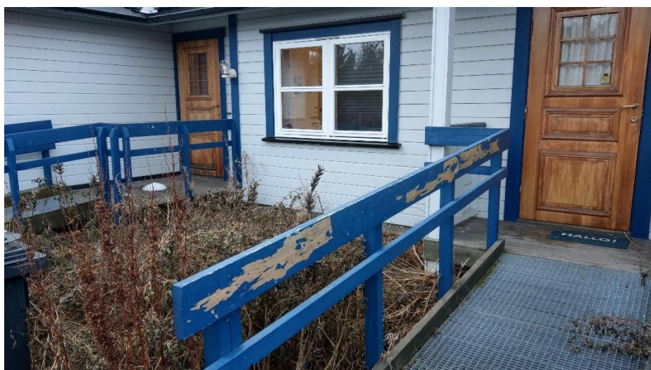
Det trenges det maling i Snorresvei 41/43