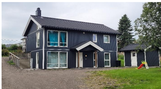
Vesterålsgata 27 nord