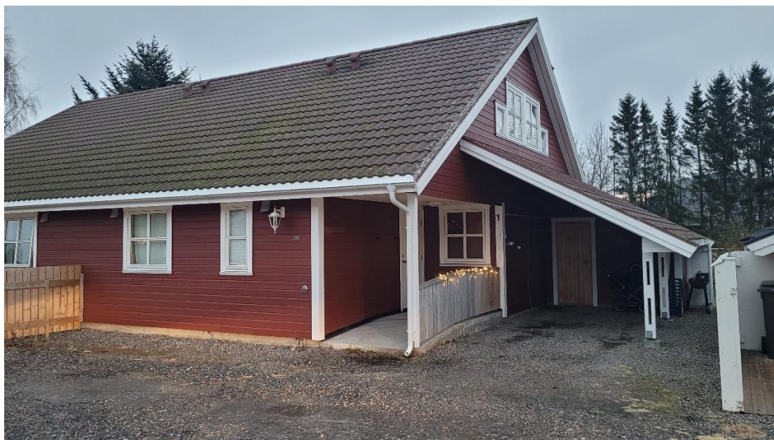
Karlesvei 26 B